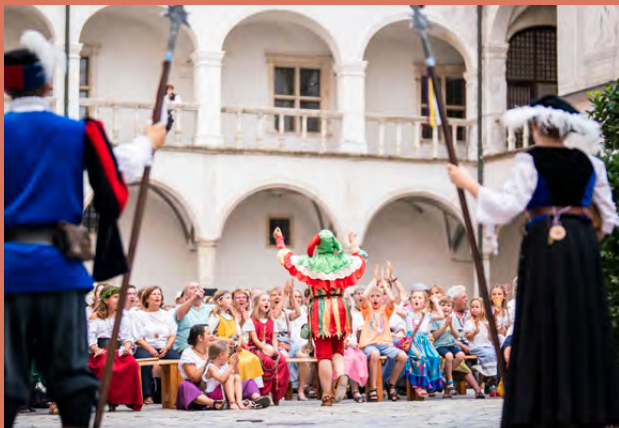
Neuburger Schloßfest | Tanz und Scherz bei Hofe