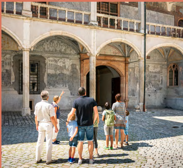
Stadtführung im Schlossinnenhof

12 € pro Person, Anmeldung erforderlich, Treffpunkt Tourist-Information