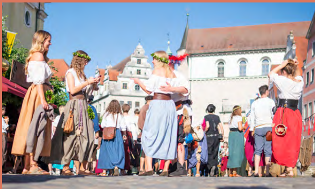
Markttreiben auf dem Neuburger Schloßfest

Weitere Informationen unter www.schlossfest.de