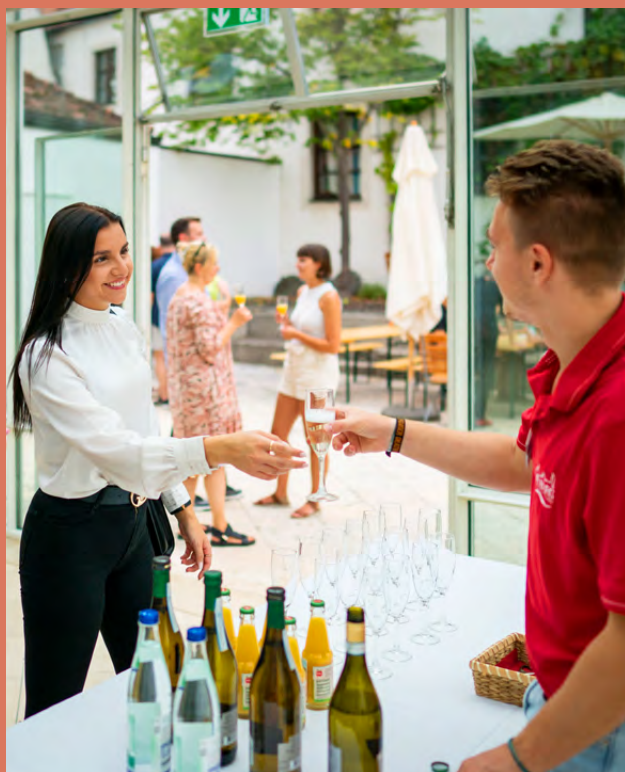
Pausenausschank im Neuburger Stadttheater